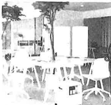
Ideja uređenja učionice

Po potrebi priložite ponude, skice, troškovnike, fotografije ili druge materijale i dokumente povezane s projektom. Prilozi nisu obavezni.