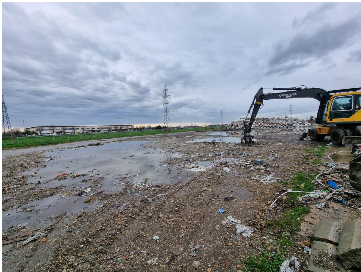
Stanje podloge nakon uklanjanja bala