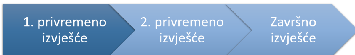
Slika 2. Faze vrednovanja tijekom izrade Strategije razvoja urbanog područja Varaždin za razdoblje od 2021. do 2027. godine

Svrha vrednovanja tijekom izrade SRUP-a i izvješća o vrednovanju jest sumirati rezultate cijelog postupka vrednovanja koje se provelo tijekom izrade SRUP-a, odnosno rezultate prve faze, druge faze i završne faze vrednovanja SRUP-a tijekom njegove izrade. Postupak vrednovanja također će uključivati i izradu nacrtu sažetka rezultata vrednovanja koji će se uključiti u SRUP, u kojem će biti prikazano kako su zaključci vrednovanja uključeni u izradu SRUP-a.