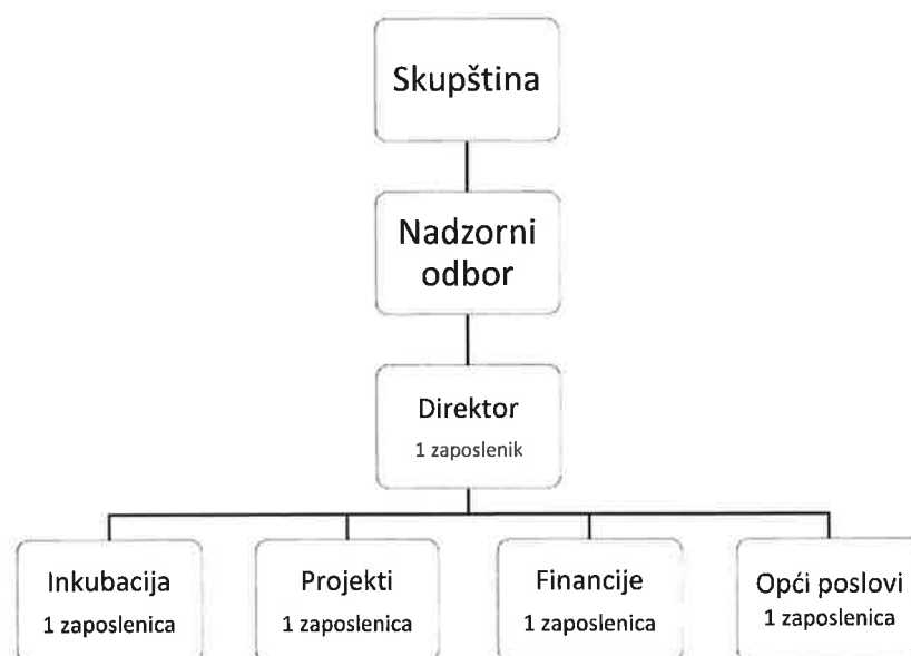
Slika 1 Organizacijska shema Tehnološkog parka Varaždin