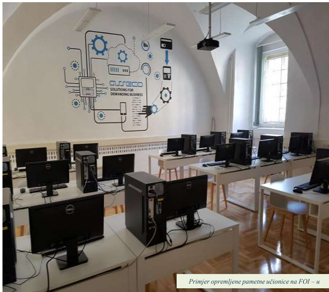
Primjer opremljene pametne učionice na FOI – u