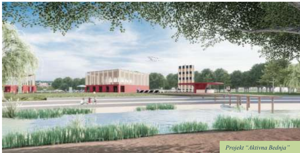
Projekt "Aktivna Bednja"

Uređenje topličkog izletišta uz toplički vodopad