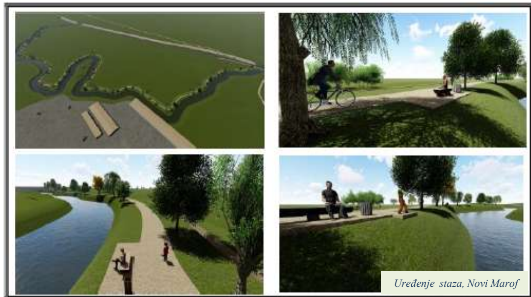
Uređenje staza, Novi Marof