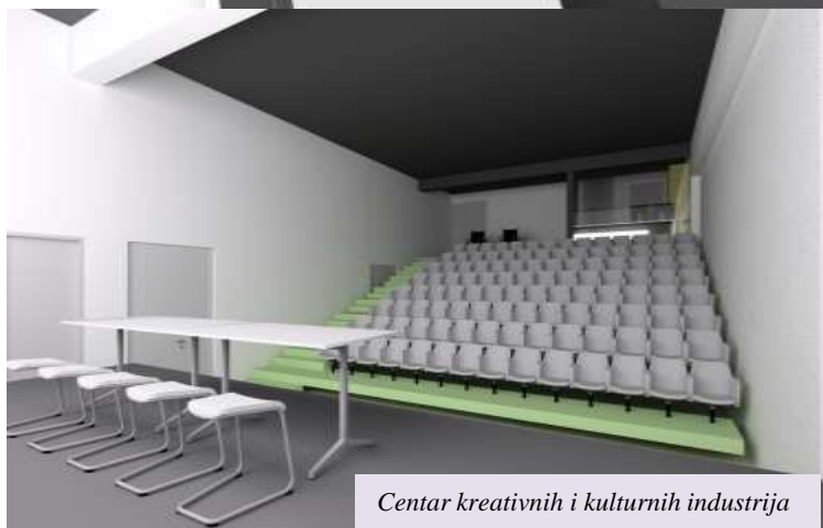
Centar kreativnih i kulturnih industrija

Varaždin, Ludbreg, Varaždinske Toplice, Maruševac, Trnovec Bartolovečki i Vinica