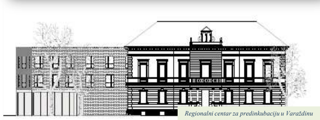
Regionalni centar za predinkubaciju u Varaždinu