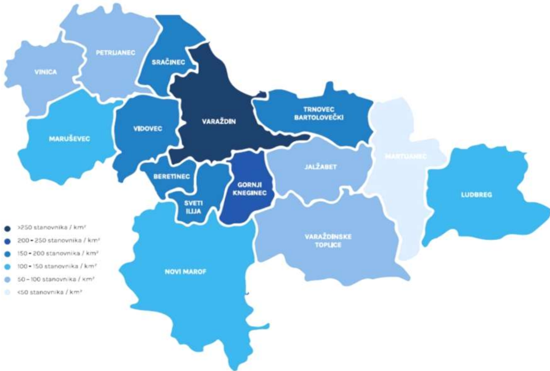
URBANO PODRUČJE VARAŽDIN (15 jedinica lokalne samouprave)