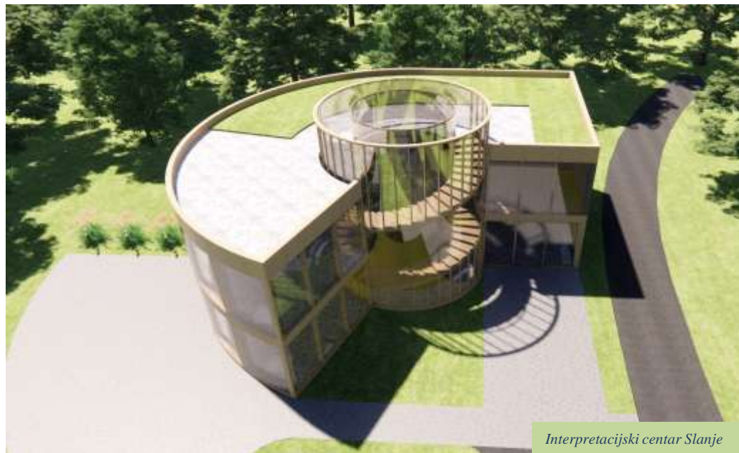
Interpretacijski centar Slanje