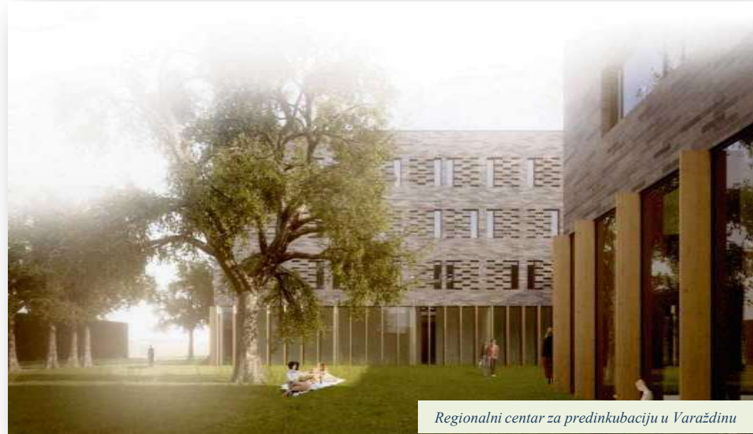
Regionalni centar za predinkubaciju u Varaždinu

2. Razvoj i provođenje predinkubacijskog programa i programa razvoja vještina i kompetencija u području pametne industrije, poduzetništva i inovacija