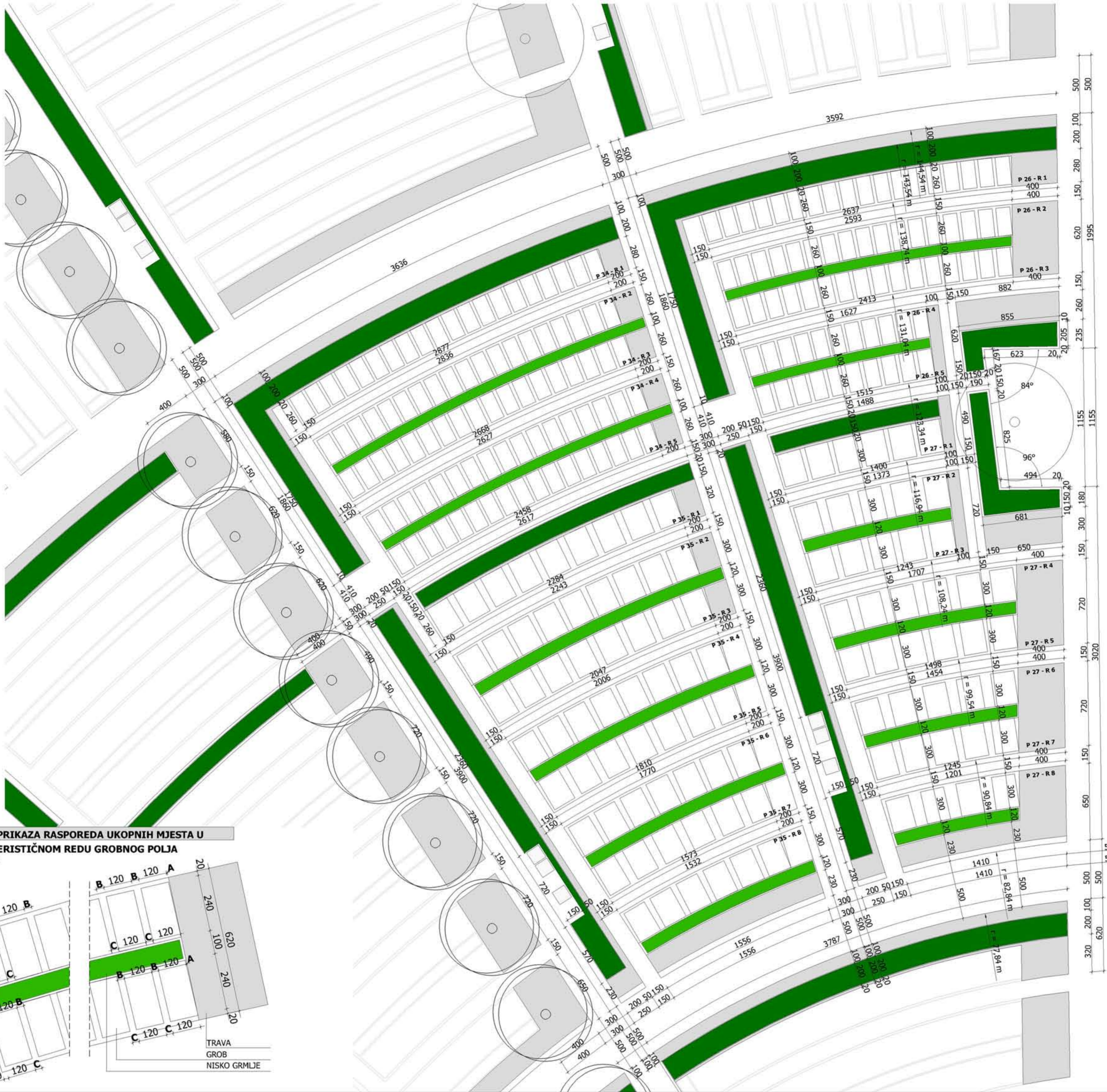
DETALJ PRIKAZA RASPOREDA UKOPNIH MJESTA U KARAKTERISTIČNOM REDU GROBNOG POLJA M. 1:100