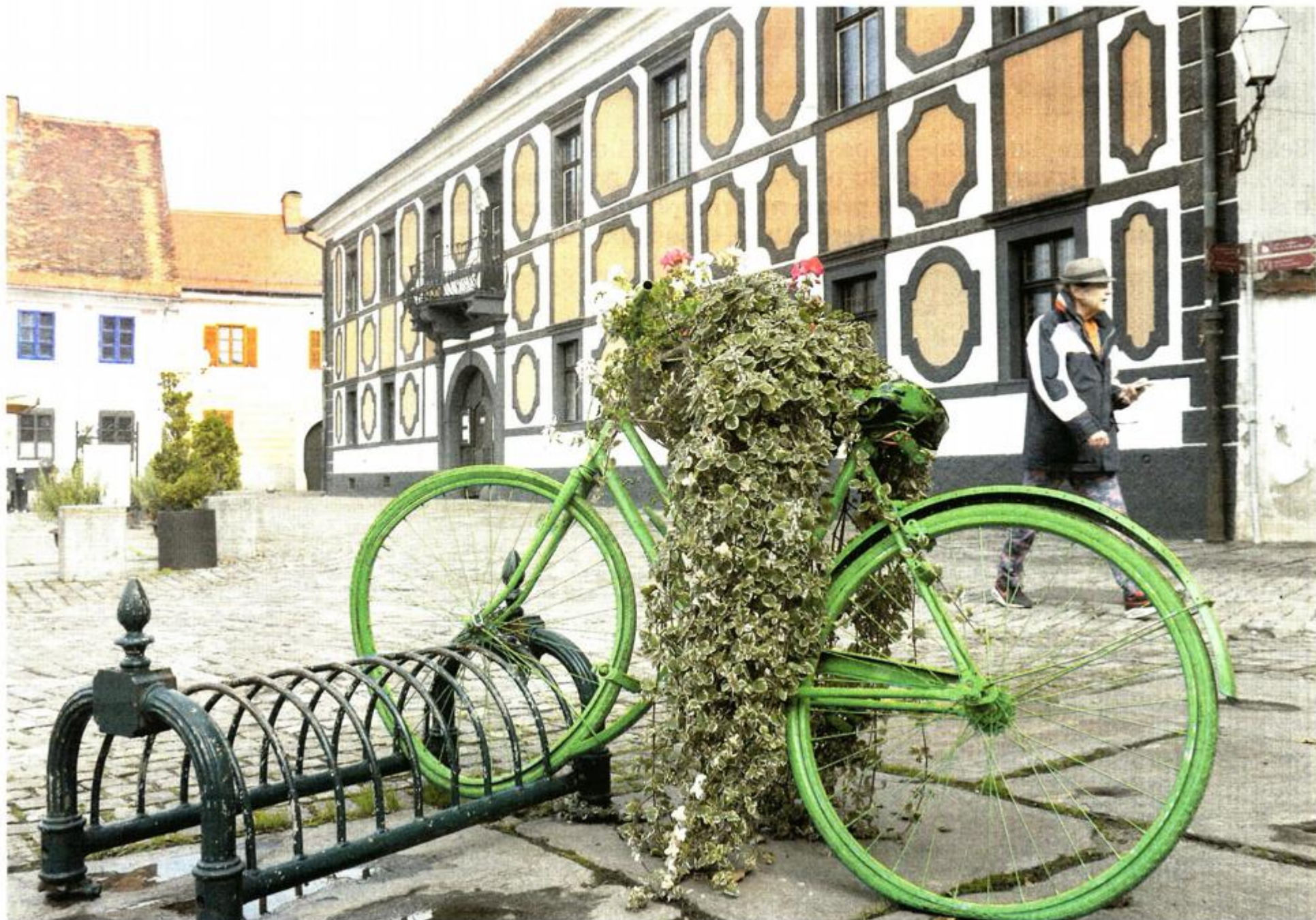
Palača obitelji Prassinsky-Sermage

Ono što je uvijek otvoreno su varaždinske ulice i trgovi. Sjevši me u kraljevsku stolicu postavljenu kraj Uršulinske crkve, Varaždin mi je dopustio da gledajući na najmanji i najmlađi gradski trg – Trg tradicijskih obrta, sama iščitam obrtničku povijest grada. Da je bila bogata – je, a da je danas samo u »tragovima«, također je istina. Ono što oduševljava je promišljanje gradskih otaca koji u Varaždinu ne dozvolije neonske reklame, pa tako na prelijepim fasadama ništa ne žmiga i ne treperi, već lijepo piše, a za sve one kojima se ne da čitati što piše na nekima postoje i tzv. cimeri. U neka davna doba bili su velika pomoć nepismenima, a u današnjici