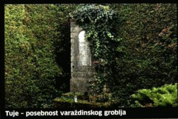
Tuje – posebnost varaždinskog groblja

Da se varaždinsko groblje svrstava među tri najljepša groblja Europe, da ga je Herman Haller 1905. posadivši 7 tisuća čempresa tzv. tuja i oblikovavši ih po uzoru na videne u francuskim parkovima pretvorio u svojevrstni park prirodi, to svi znaju. Ali koliko njih zna da Varaždincima, uz osnovnu namjenu, već desetljećima i desetljećima groblje služi i kao mjesto za »rendes«? U vječnoj igri svjetla i sjene, zaigrat se znaju i eros i tanatos.