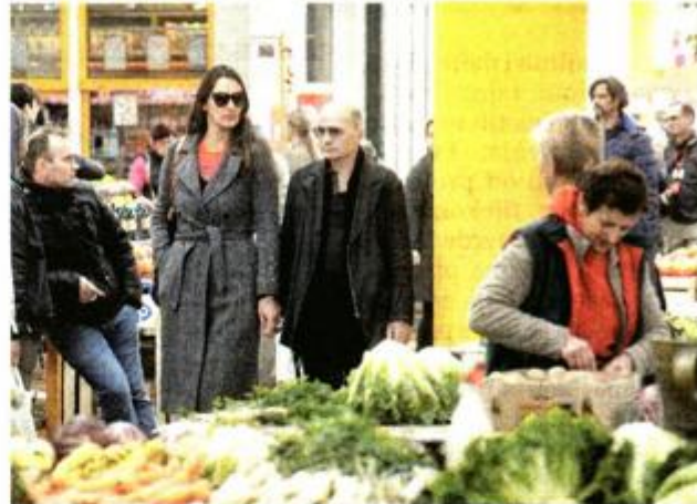
Na placu uvijek zanimljivo

Nakon igre na red su došle palače. Varaždin ih ima bezbroj. Svaka ima svoju priču, a iz bogate palete izdvajamo, ne ni palaču Drašković u kojoj je zasjedao Hrvatski sabor, a od 1767. godine bila sjedište Kraljevskog namjesničkog vijeća, ni palaču Herczer koju je dao izgraditi ne plemić već poštar, koji si je kupio plemićku titulu, dobio na lutriji i brzo izgradio palaču, ali isto tako brzo i izgubio ne samo palaču nego i svo ostalo bogastvo, ni palaču Varaždinske županije, ni onu obitelji Prassinsky-Sermage koja krije priču o ljubavi bogate Varaždinke i siromašnog francuskog grofa, već priču o palači Patačić. Na tu temu Varaždin prozbori: ovo je moja najvrednija rokoko palača. Sagrađena je 1764. godine no, pričati o njoj znači i pričati o velikom požaru što ga je 25. travnja 1776. zbog zubobolje prouzročio dječarac koji je na obližnjem majuru čuvao svinje. Mališu je bolio