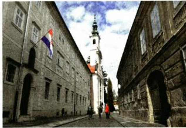
Kraj Samostana Uršulinki prema Starom gradu