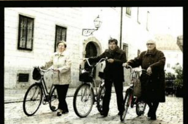
Život na dva kotača

Akademski slikar Ivan Mesek zaslužan je i za tzv. krinolinu ljubavi, skulpturu što krase ulicu Silvija Strahimira Kranjčevića. Za ovu instalaciju Mesek je uporište našao u priči Ksavera Šandora Gjalskog, priči koja priča o tragičnoj ljubavi lajtnanta Milića. Cilj umjetnine je da mrežastu skulpturu koja predstavlja krinolinu, visoku 2,5 metra zaljubljeni odjenu u ruho ljubavi. A to će činiti tako da na nju vješaju »lokotiče«, u svijetu simbol za vječnu ili neraskidivu ljubav. Zaljubljeni potom ključice odnose u Stari grad i ubacivši ih u bunar dvorca još jednom »osiguravaju« ljubavi vječnost.