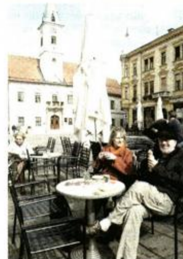
Kava na glavnom gradskom trgu

Varaždin zavole svi koji ga vide, pa nikakvo čudo što su upravo u njemu dom našla i bucasta, krilata stvorenja imena anđeli. Varaždin im je u znak zahvalnosti dao Muzej, a i andelinjak, skroviti prolaz u kojem se leteća mala bića mogu zabavljati koliko im srce hoće. Ne vjerujete da anđeli postoje, da žive u Varaždinu, da i vi imate svoga ili više njih koji vas čuvaju... E, pa ako ne, onda je krajnje vrijeme za odlazak u Varaždin. Svako