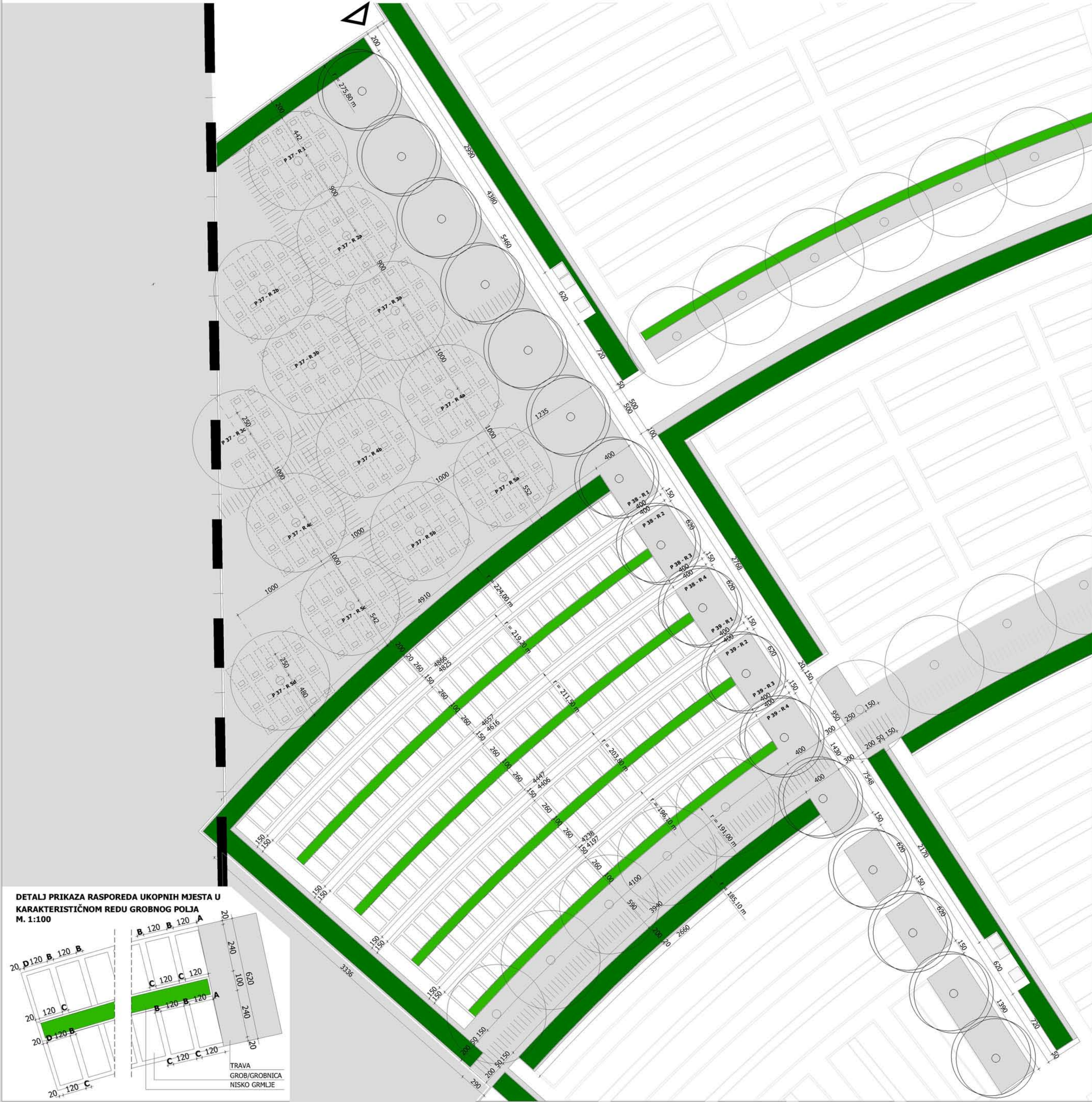
DETALJ PRIKAZA RASPOREDA UKOPNIH MJESTA U KARAKTERISTIČNOM REDU GROBNOG POLJA M. 1:100