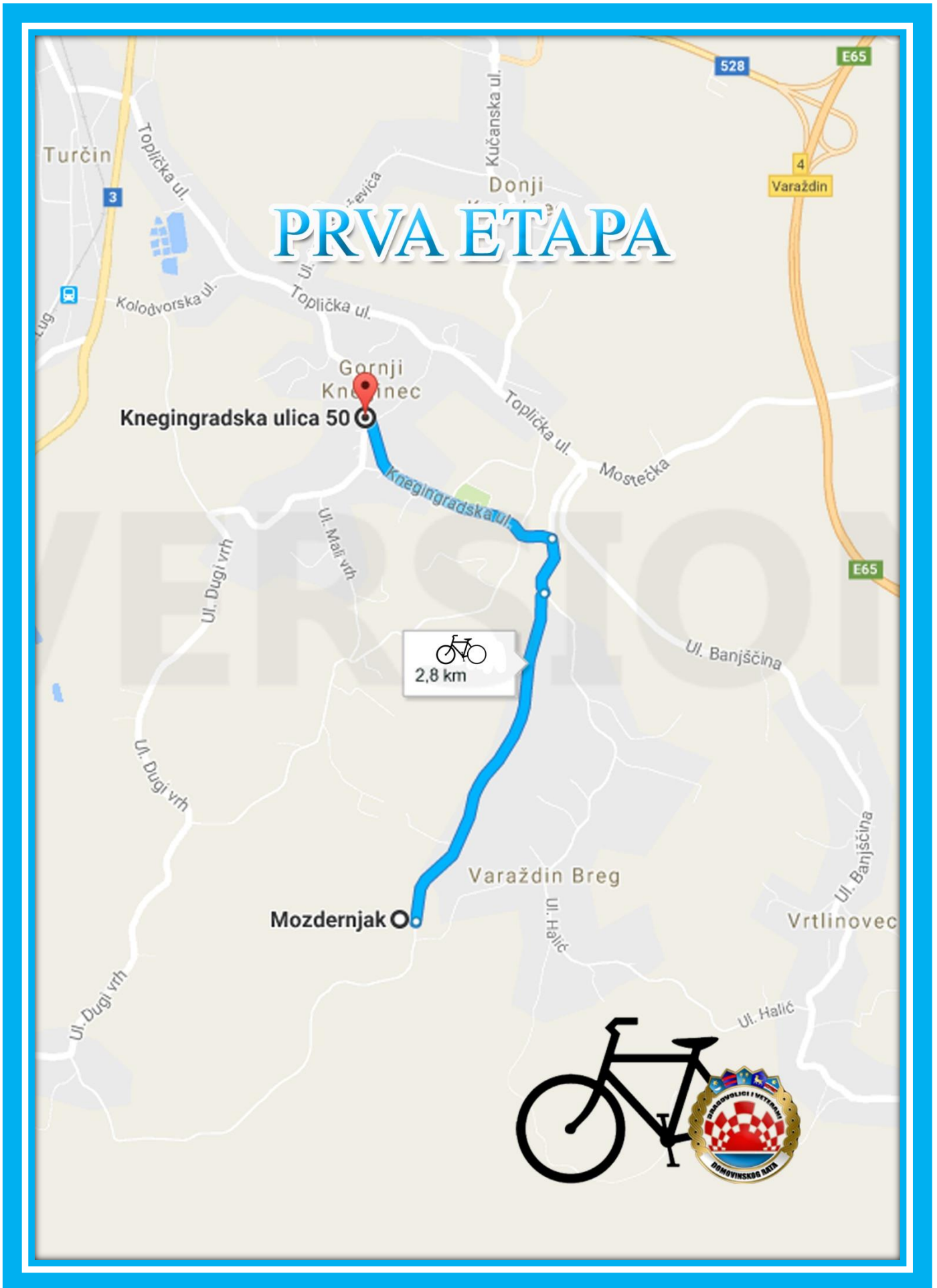
Karta 1. Prva etapa