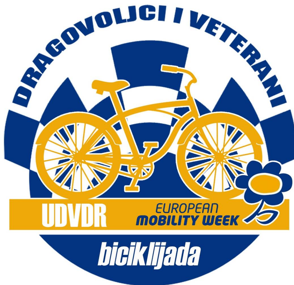
Slika2. Izgled loga biciklijade