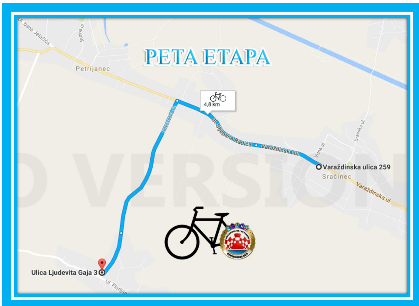
Karta 5.Peta etapa

GPS koordinate cilja: 46°19'11.9"N 16°13'47.0"E