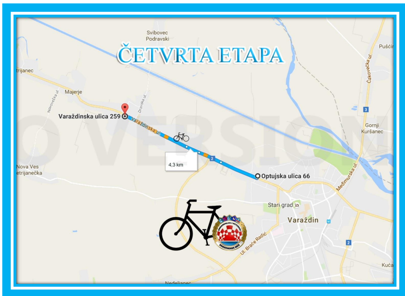
Karta 4. Četvrta etapa

GPS koordinate Cilja: 46°20'02.8"N 16°15'59.6"E