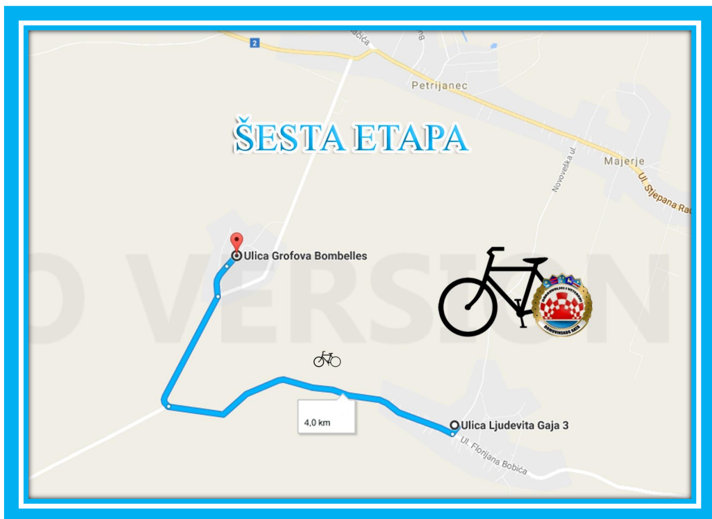
Karta 6. Šesta etapa

GPS koordinate cilja: 46°20'01.1"N 16°12'25.9"E