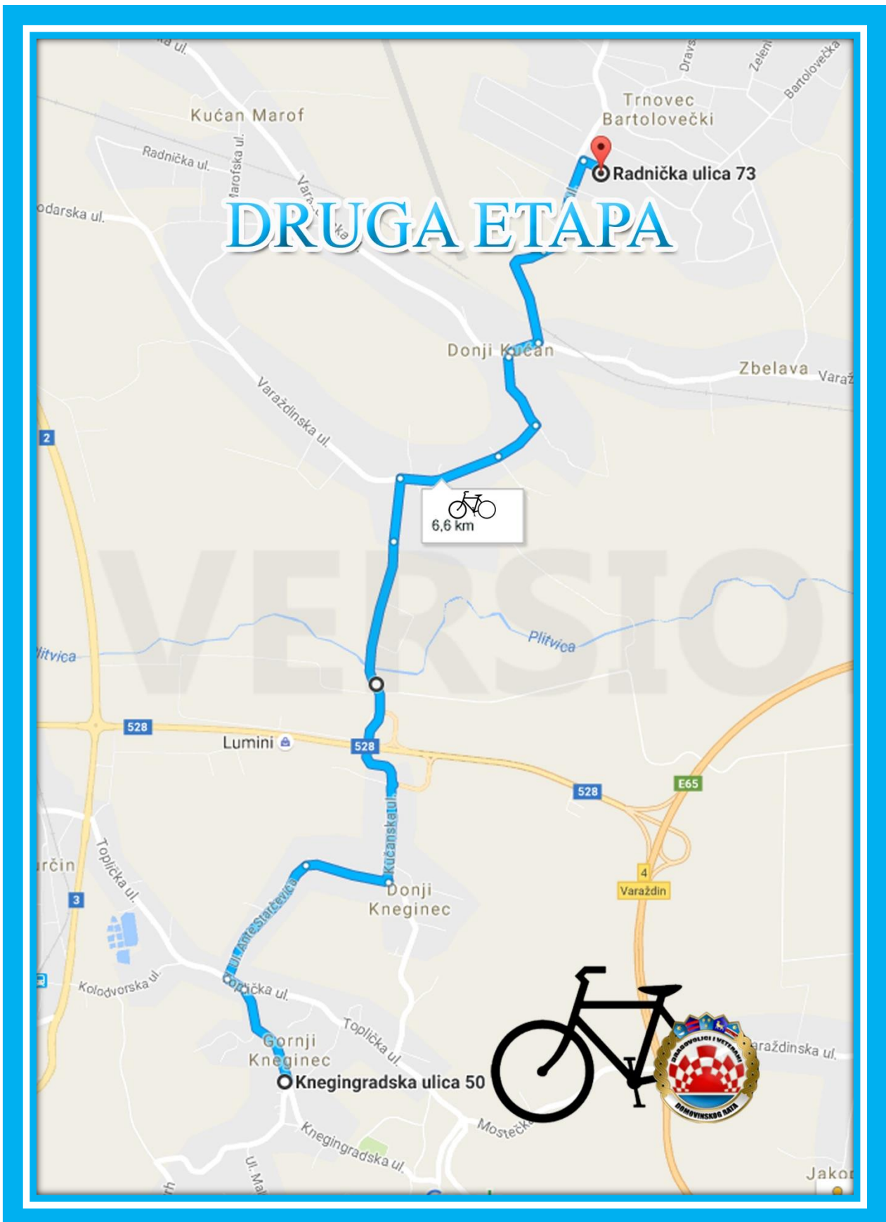
Karta 2. Druga etapa