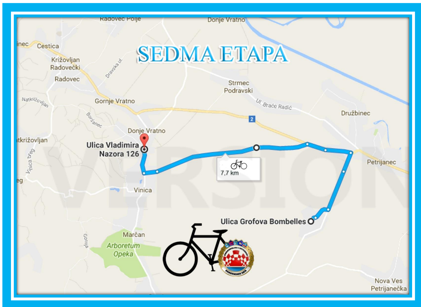
Karta 7. Sedma etapa

GPS koordinate cilja : 46°20'54.5"N 16°09'13.1"E