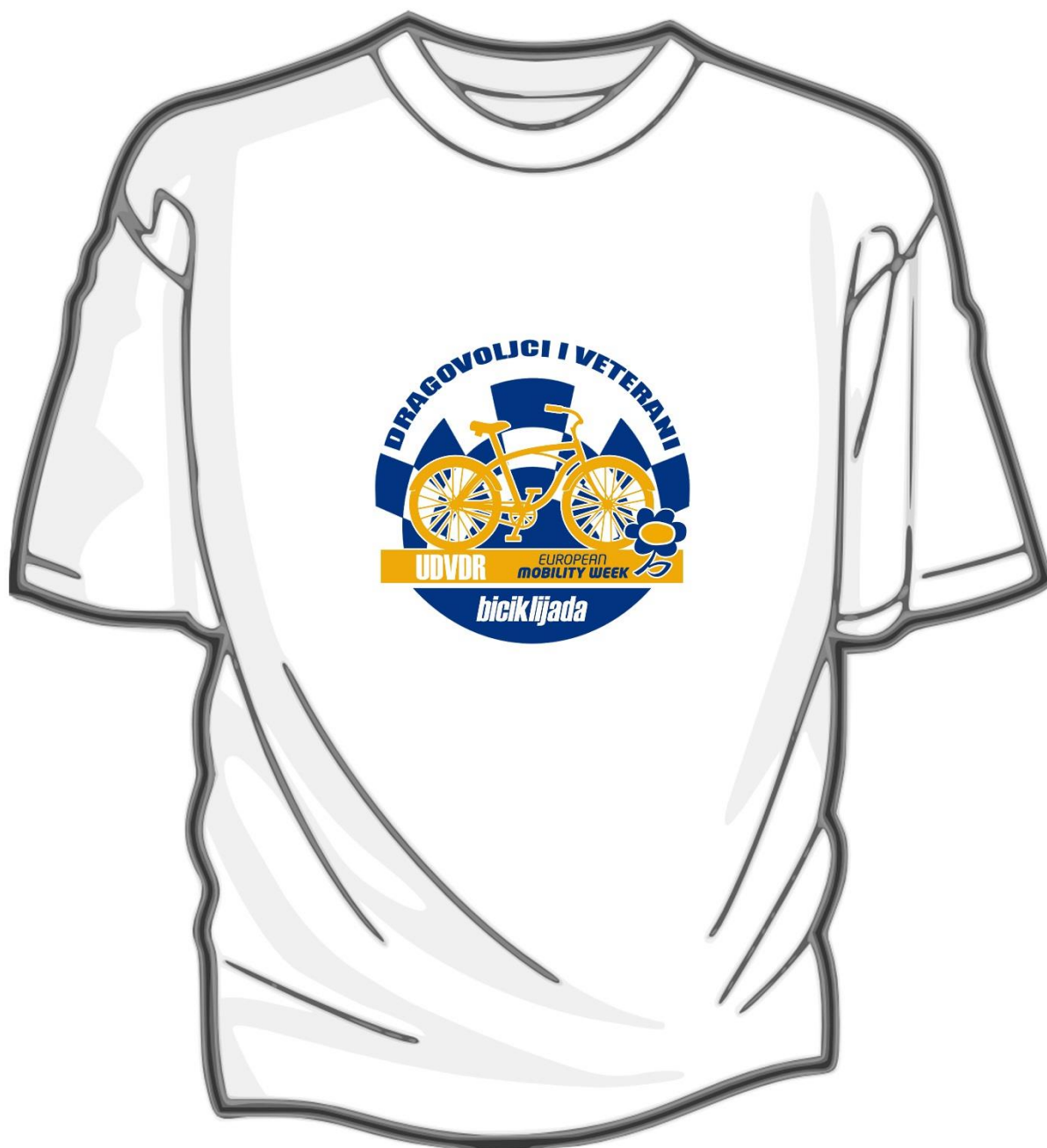
Slika 3. Izgled majice biciklijade