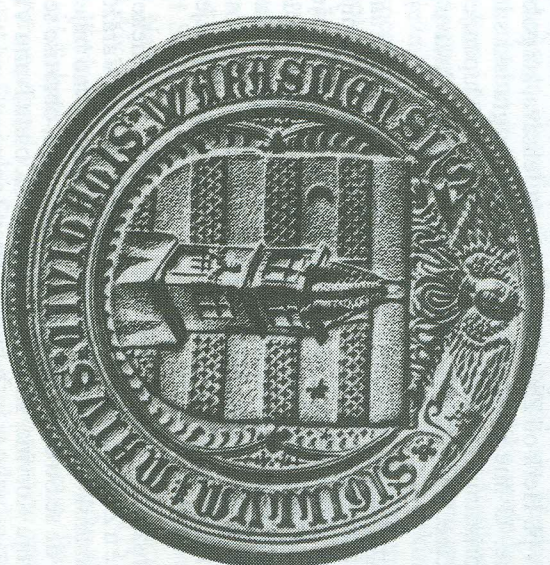
Veliki pečatnjak grada Varaždina iz 1464. godine.

Kako je kralj Matija Korvin bio sklon građanima varaždinskim, lijepo se razabire iz njegove listine od god. 1468. Tada je, naime, kralj na molbu Varaždinskog magistra odredio da se ne smije nikakva carina ubirati od onih ljudi koji po rijeci Dravi dopremaju daske i drugo građevno drvo za potrebe grada Varaždina. (Listina broj 132 u Arhivu grada Varaždina).