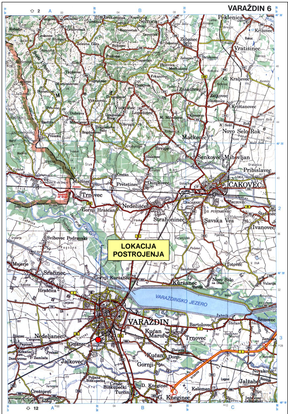
Prilog 1. Topografska karta šireg područja lokacije postrojenja